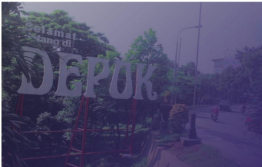
Gambar 1 Mengisi Form Login

Mengisi form login dengan email dan password yang telah terdaftar pada database.